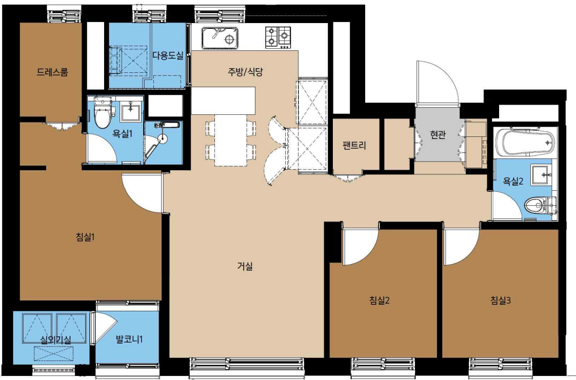
59B형 단위세대 평면도